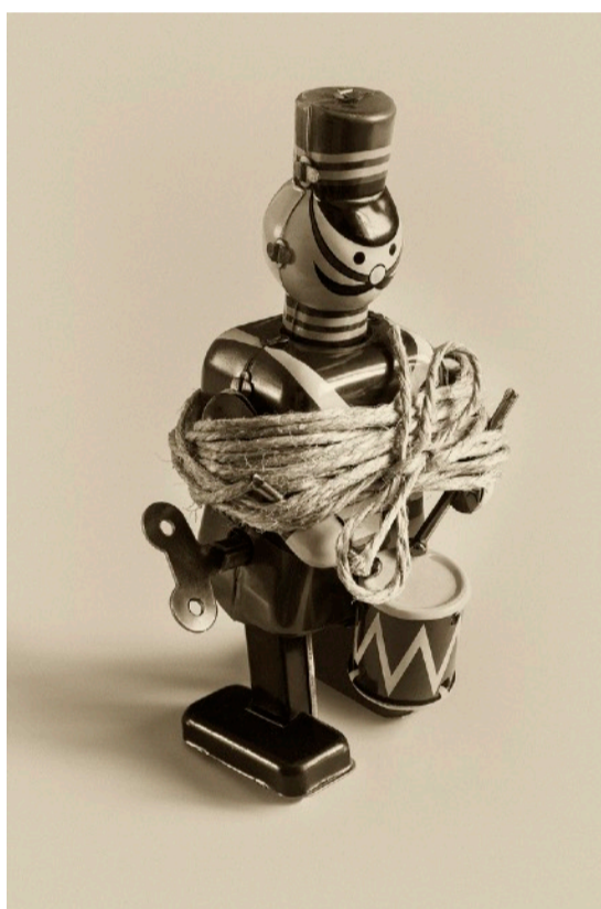
Le photographe surréaliste de l'année Mario CUCCHI